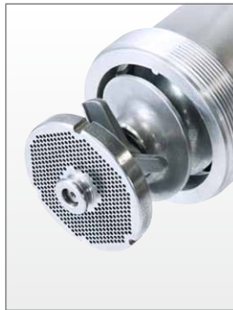
Plate 3 mm with hub and 4 slots, cross-knife (4 blades)